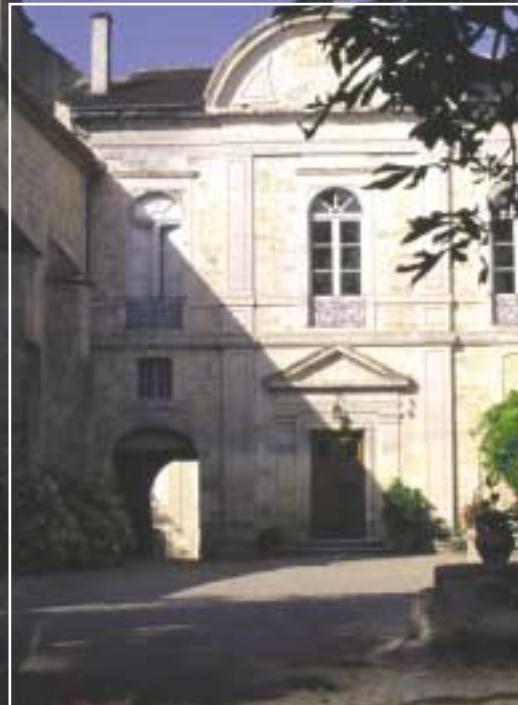
CHÂTEAU DE CASSAIGNE

Dès que vous franchirez le portail de cette ancienne résidence de campagne des Evêques de Condom, vous serez séduit par son architecture harmonieuse, ses jardins où il fait bon flâner et par la visite de son chai entièrement dédié au vieillissement de "l'âme ardente" qui fait la réputation de la Gascogne : le flambant Armagnac.