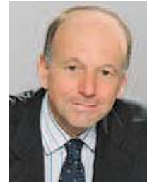
François Auque Président d'EADS SPACE

EADS SPACE Filiale à 100% d'EADS, est un leader mondial de l'industrie spatiale. La Division Espace conçoit, développe et fabrique des satellites, des infrastructures orbitales et des lanceurs, par l'intermédiaire de ses filiales, EADS Astrium et EADS SPACE Transportation ("EADS ST") et fournit des services spatiaux par l'intermédiaire de sa filiale, EADS SPACE Services. La Division Espace fournit également des services de lancement, par le biais de ses participations dans Arianespace, Starsem et Eurockot, ainsi que des services liés aux satellites de télécommunication et d'observation de la terre, par l'intermédiaire de ses sociétés spécialisées telles que Paradigm. Employant quelque 11000 personnes sur ses sites en France, en Allemagne, au Royaume-Uni et en Espagne, EADS SPACE contribue aux activités du Groupe à hauteur d'environ 8 %